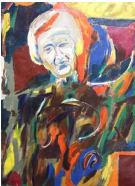
Sergiu Celibidache I, 2002; 160 x 110 cm, Öl/Leinwand

Die gegenwärtig in Wels gebotene Ausstellung präsentiert sämtliche Arbeiten aus der Figurativen Werklinie des deutschen Künstlers.