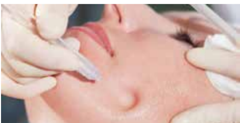
JETPEEL – High-Tech aus der Luft- und Raumfahrt

Bei einem Feuchtigkeits-Vitaminpush mit unserem JETPEEL – Die High-Tech Beauty Wunderwaffe.