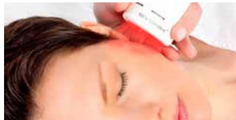
Bio-Lifting, für ein besseres, strafferes Hautbild schon ab dem ersten Einsatz.

Intensiv Anti-Aging: Hochkonzentriertes Hyaluron mit Antioxidantien – ohne Injektion mit unserem BYONIK KALTLICHTLASER – das Erste Bio-Lifting, dass sich an Ihrem Herzschlag orientiert.